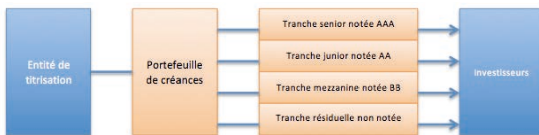
Schéma 2. La structure de l'organisme de titrisation : la division du portefeuille de créances en tranches.

14. Le découpage en tranche de l'organisme de titrisation. – Ce processus se déroule au sein même de la structure de l'organisme de titrisation, comme illustré par le schéma suivant 20 :